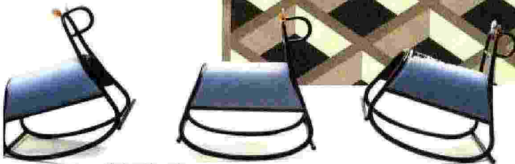
Chaises à bascule Rocking chairs Furia Gebrüder Thonet Vienna