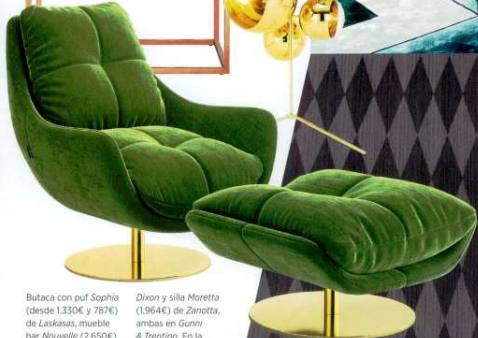
Butaca con pul Sophia (desde 1.330€ y 787€) de Laskasas , mueble bar Nouvelle (2.650€) de Jonathan Adler , lámpara Mirror Ball (3.473€) de Tom