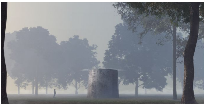
Vatican Chapels, la cappella progettata da Smiljan Radic Clarke