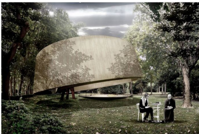
Vatican Chapels, la cappella progettata da Javier Corvalán Espinola

Scolte le riserve sui protagonisti di Vatican Chapels, il "padiglione diffuso" con cui la Santa Sede esordirà alla Biennale Architettura 2018. Foster, Souto de Moura, Cellini e Flores&Prats tra i progettisti invitati.